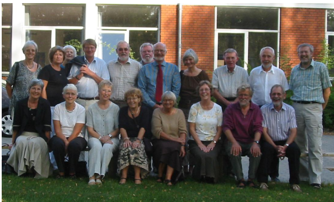
Seminarieklassen 2006 i gården ved Silkeborg Seminarium på Århusbakken.

Badeanstalten, Mad på KFUM, Den skarpe med terningspil, Århusbakken, Indelukket.